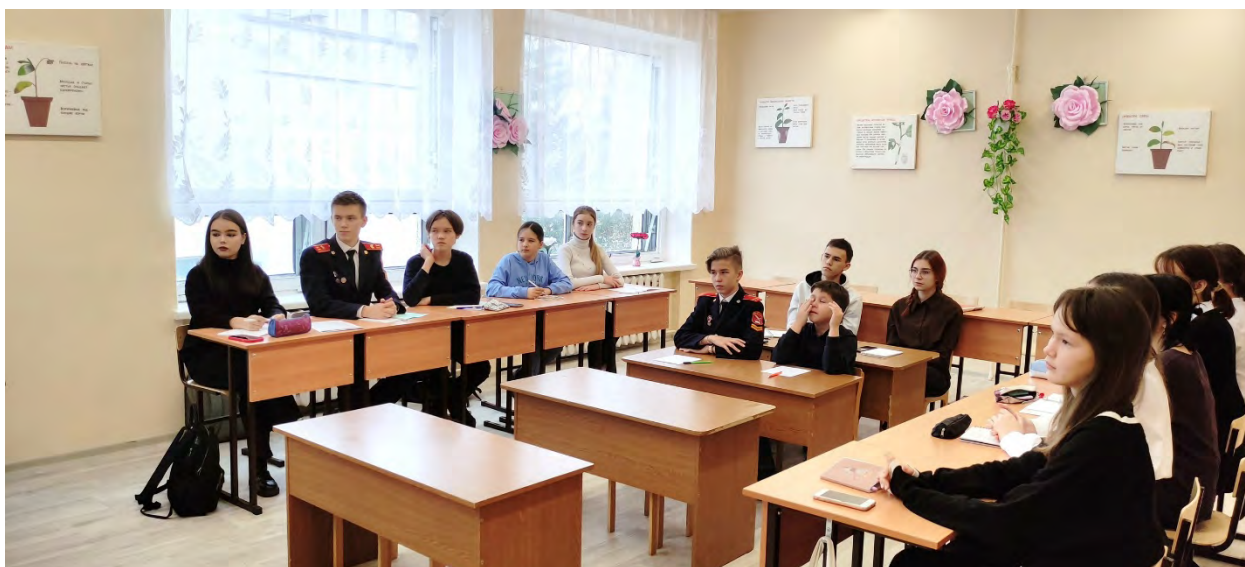
Учащиеся объединения «Школа дикой природы»